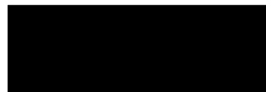
Martina Šoustalová místostarostka

V souladu s nařízením EU 2016/679, o ochraně fyzických osob v souvislosti se zpracováním osobních údajů a o volném pohybu těchto údajů a o zrušení směrnice 95/46/ES, a zákonem č. 110/2019, o zpracování osobních údajů, je dokument zveřejněn v upravené podobě.