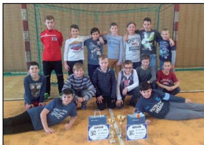
V sobotu 14.1.2017 se mladší žáci zúčastnili kvalifikace na Desetiboj v Karviné a umístili se na krásném 1. a 3. místě.