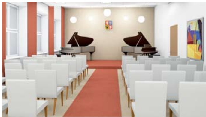
vizualizace obřadní síně

Závěrem přesvědčení a jedno přání. Dílo se podaří a přejeme naší Staré škole, ať si také po rekonstrukci nadále užívá své výjimečné postavení, které jí s ohledem na její krásu a historii bezpochyby náleží.