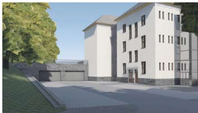
vizualizace nádvoří: v zadní části přístavba garáže, vpravo částečně prosklený výtah

školu. K východnímu traktu ze severní strany bude přistavěna garáž pro vozidla a technické zázemí údržby městského obvodu. Objekt této přístavby bude zapsán do svahu přilehajícího parku a střecha osázená vhodnou vegetací tak, aby splynula s okolní zelení. Bezbariérový přístup ke všem podlažím zajistí instalace výtahu. Stávající dvůr bude upraven a rozšířen pro umístění dostatečného počtu parkovacích stání, příjezdová komunikace bude propojena výjezdem na parkoviště za objektem Hrušky. Po dobu rekonstrukce bude území kolem objektu oploceno, nebude možno zde parkovat ani procházet přes dvůr mezi parkem a ul. 1. května. K podání uceleného přehledu je potřeba uvést, že pro současný objekt radnice čp. 1, bude v souladu s výše citovanou koncepcí zpracována dokumentace, zabývající se jeho přestavbou na byty pro seniory.