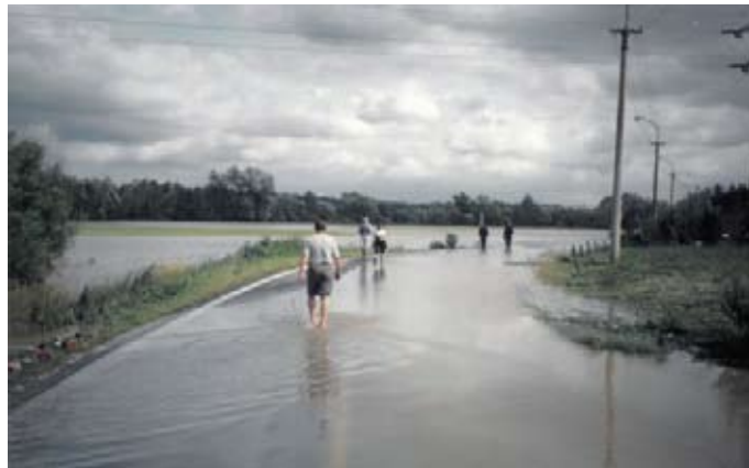
1.května - za tratí

a pomocí člunu jsme sudy přemístili na vyvýšené místo u křižovatky na Dolní Polance. I v této době se občané u Strouhy na ulici 1. května a Za Strouhou nechtěli evakuovat. Večer v 22.07 hod. za silného deště, byla naše jednotka povolána CTV k evakuaci starší osoby v chatové osadě v Krásném Poli. Po složité cestě z důvodu zatopení Svinova (u válcovny trub 1 m vody), spadlých mostů přes potok Porubku, jsme