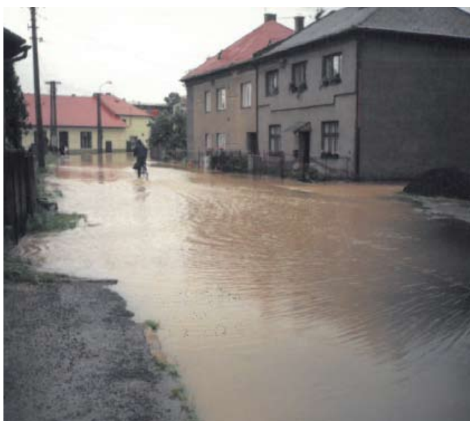
Most 1.května v zatáčce k hostinci u Dluhošů