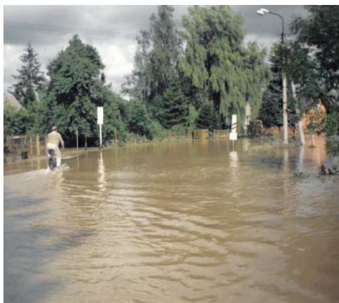
1.května za křižovat. s ul. Svinovskou