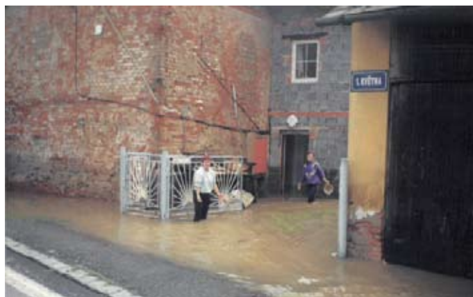
1.května - RD č.p. 230

Ráno 9.7. 1997 jsme byli nasazeni v Hrušově k evakuaci osob a zdravotnického materiálu ze skladu. V poledne po dlouhé době poprvé