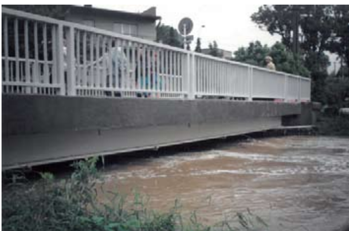
Most u splavu