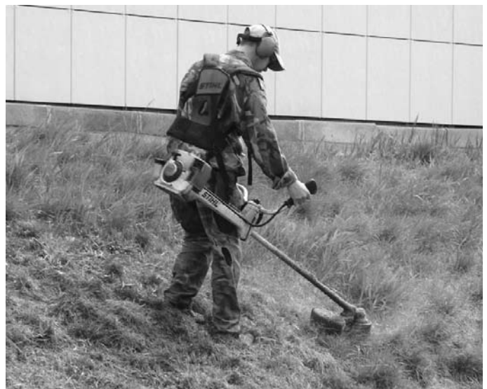
Odkaz - Vyhláška 4/2012

www.ostrava.cz/cs/urad/pravni-predpisy/vyhlasky-statutarniho-mesta-ostavy/4-2012