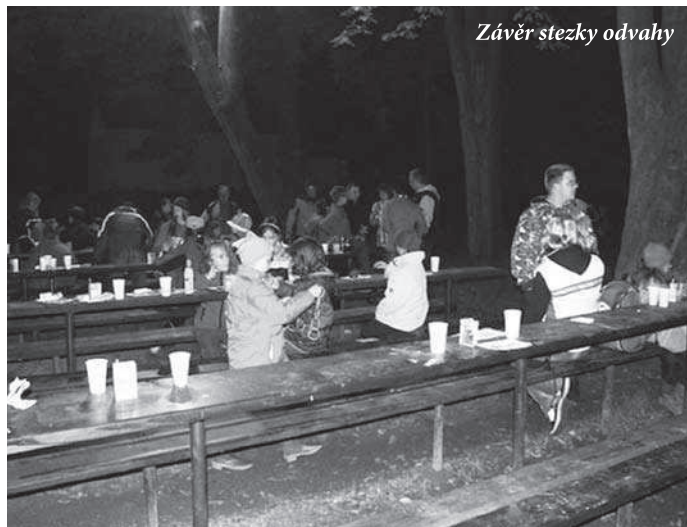
Závěr stezky odvahy