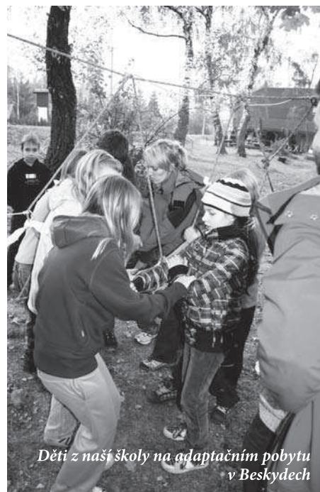
Děti z naší školy na adaptačním pobytu v Beskydech