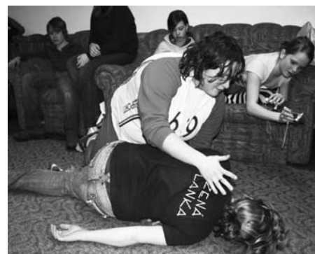
Ukázka na přednášce o první pomoci – stabilizovaná poloha