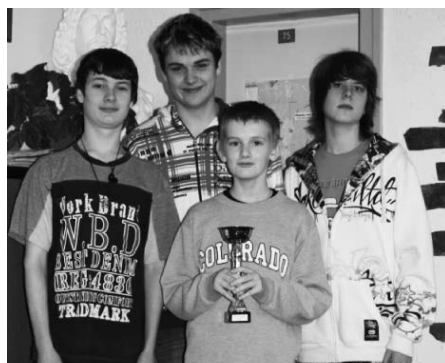
Pohár za druhé místo v okresním přeboru šachových družstev základních škol.