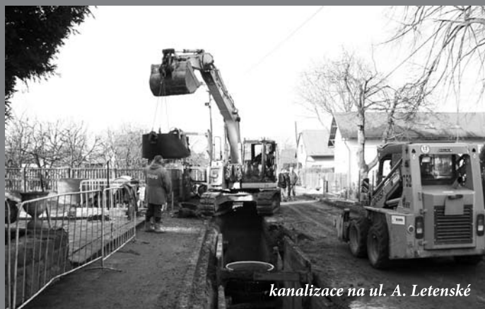
kanalizace na ul. A. Letenské