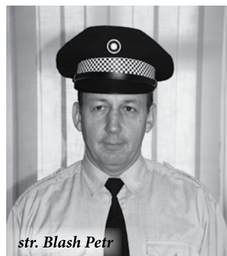
str. Blash Petr