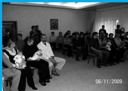
Rodiče se svými dětmi