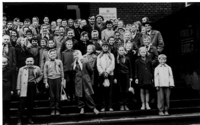
Společné foto (17.10.1958) z první návštěvy zliechovských dětí v Polance nad Odrou – snímky jsou pořízeny u Domu umění v Ostravě.