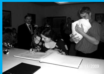
Podpisy do pamětní knihy narozených dětí