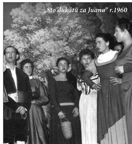
„Sto dukátů za Juana“ r.1960

S ochotnickým divadlem bylo spojeno mnoho dalších činností - kulisy, osvětlení, líčení herců, kostýmy, nápověda, hlediště - židle v sále nebo lavice v divadle v přírodě, uvádění diváků, nejrůznější rekvizity - zbraně, nářadí, nádoby atd.