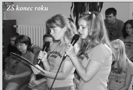
ZŠ konec roku