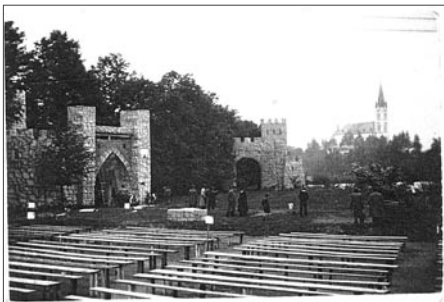
Divadelní představení v přírodě - HUSITĚ Sokolské louka v Polance n. Odrou 1955

Vměstnat výčet 88 premiér (ještě jedna se dodatečně objevila) hraných těsně po válce na jedinou stránku Polanského zpravodaje je nemožné. Proto jsem připomněl jen ty nejznámější a nabídl zaslání úplného seznamu (zdarma) komukoli, kdo o to požádá e-mailovou poštou.