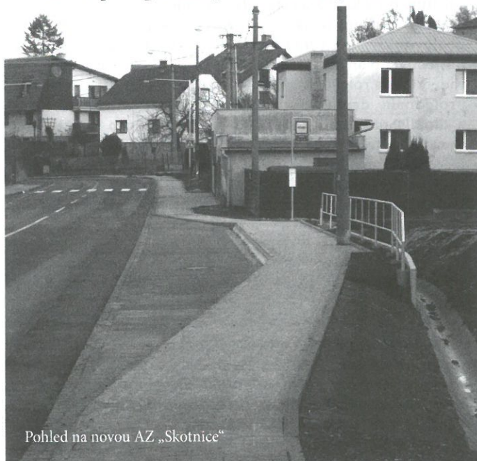
Pohled na novou AZ „Skotnice“

Dlouhodobým cílem našeho zastupitelstva je vybudování jednostranného chodníku podél hlavní silnice přes celý katastr Polanky n.O. a tak zajistit bezpečný pohyb chodců podél nejfrekventovanější silnice v našem městském obvodu. Jedná se o úkol po všech stránkách náročný, navíc do značné míry závislý na finančních zdrojích mimo rozpočet našeho městského obvodu. Přípravné práce spojené s výstavbou chodníku podél ulice 1.května započaly již v roce 1999. Vlastní výstavba pak v roce 2001 a pokračuje po jednotlivých etapách až do současnosti.