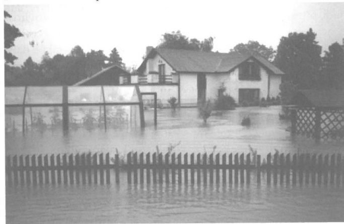
„Ulice Svinovská – pohled na RD č.p.242“