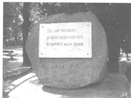
Druhá část balvanu je umístěna na konci centrální komunikace místního hřbitova