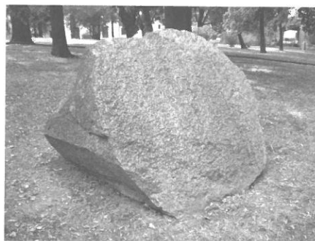
Jedna část balvanu je umístěna v parku pod kostelem sv. Anny