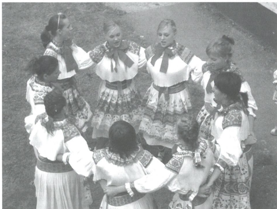
Folklorní taneční soubor děvčat v krásných zliechovských krojích