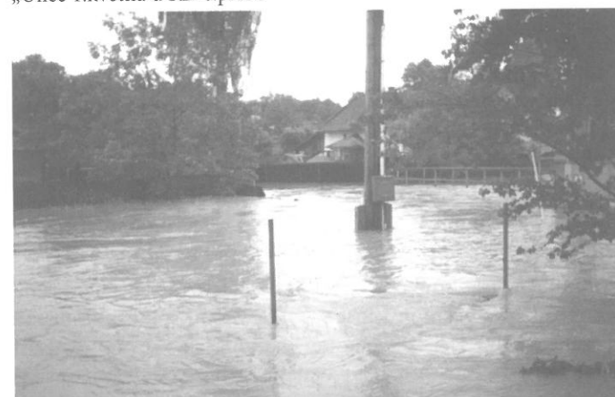
“Pohled z ul. Skotnice na lávku přes Polančici“