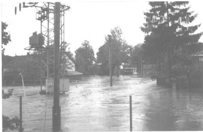
„Ulice Nábřežní – pohled směrem na Klimkovice“