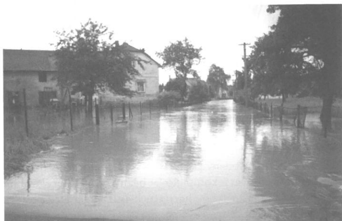
„Ulice Malostranská – pohled od mostu u splavu“

Alespoň několika fotografiemi si připomeňme jak to u nás po 6. červenci vypadalo.