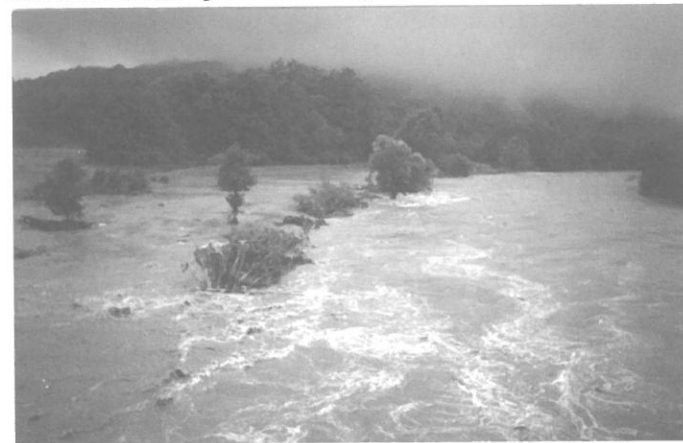
“Pohled na Odru z mostu u Honzuly“