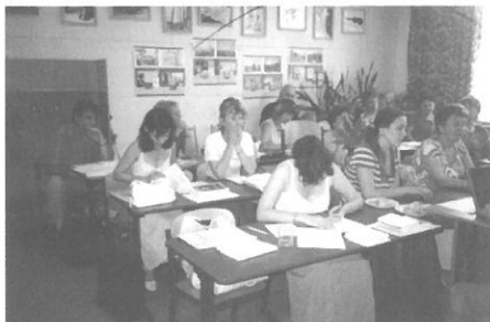
Učitelé ZUŠ připravují nový školní rok

Léto je v plném proudu, děti i dospělí užívají, či užívají zasloužené týdny volna, relaxují zcela jinou činností než v běžném pracovním roce. Především žáci školního věku potřebují vybit energii, domyslet na povinnosti a užívat prázdnin plnými doušky. Učitelé také „vypnou“, směřují své aktivity tak, aby načerpali spoustu především duševních sil. Vždyť školní rok 2006/2007 byl zase plný hektické práce a to nejen ve výukových programech, ale i ve veřejné kulturní aktivitě, dominovali jsme i na soutěžních polích a ve výchovných programech.