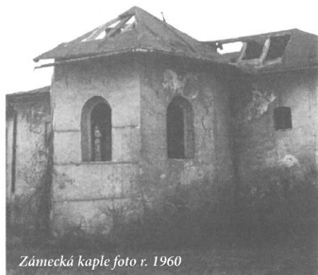
Zámecká kaple foto r. 1960