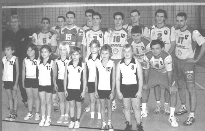
nahoře VK DHL OSTRAVA – muži