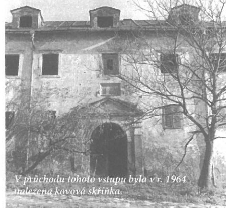
V průchodu tohoto vstupu byla v r. 1964 nalezena kovová skříňka.