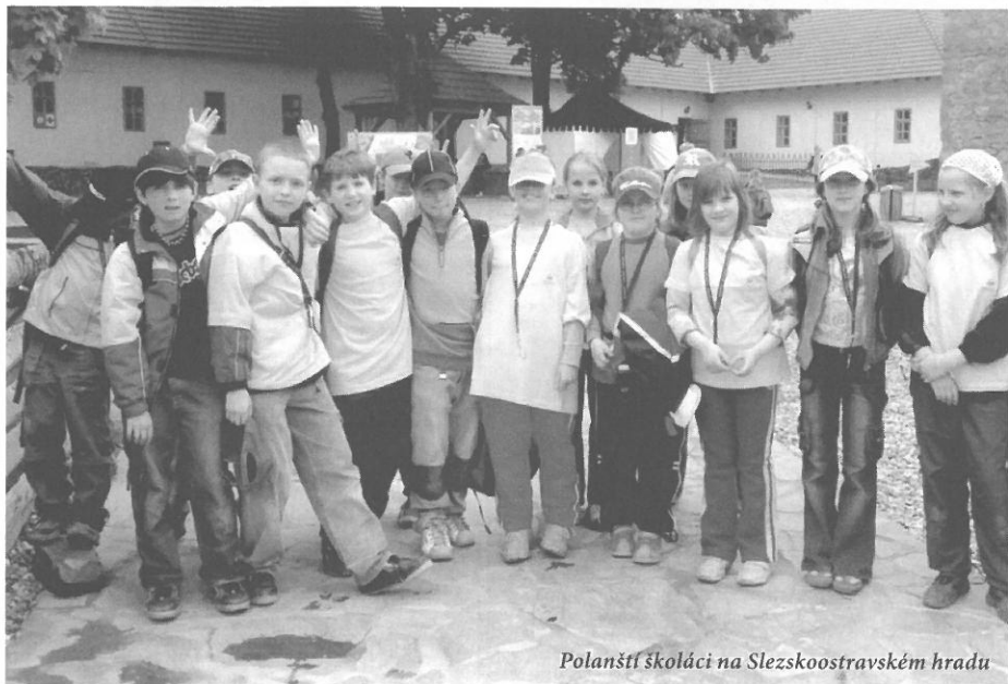
Polanští školáci na Slezskoostravském hradu

V průběhu roku 2006 získala Základní škola Heleny Salichové v Polance nad Odrou finanční podporu formou dotace z rozpočtu Moravskoslezského kraje v rámci programu Podpora aktivit v oblastech sportu, vyu-