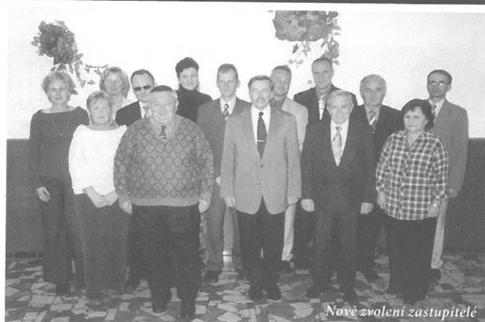
Nově zvolení zastupitelé

Vážení spoluobčané, dovolte mi, abych Vám poděkoval za důvěru, kterou jste mi projevili v nynějších volbách. Věřím, že zkušenosti, které jsem získal v této funkci v minulých letech budu moci zúročit ve prospěch Polanky nad Odrou a s novým zastupitelstvem dovést naši obec opět o stupínek výš. Vážím si Vaší důvěry a budu se snažit Vás nezklamat.