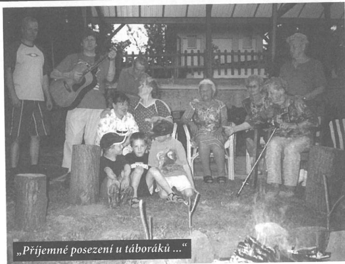
„Příjemné posezení u táboráků...“