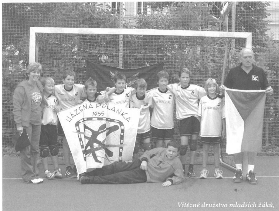
Vítězné družstvo mladších žáků.

Stalo se již tradicí, že se házenkářský klub DTJ Polanka každý rok o prázdninách účastní některého z velkých evropských mládežnických turnajů. Nejinak tomu bylo i letos. Po návštěvách Slovinska, Itálie a Švédska tentokrát padla volba na sousední Rakousko.