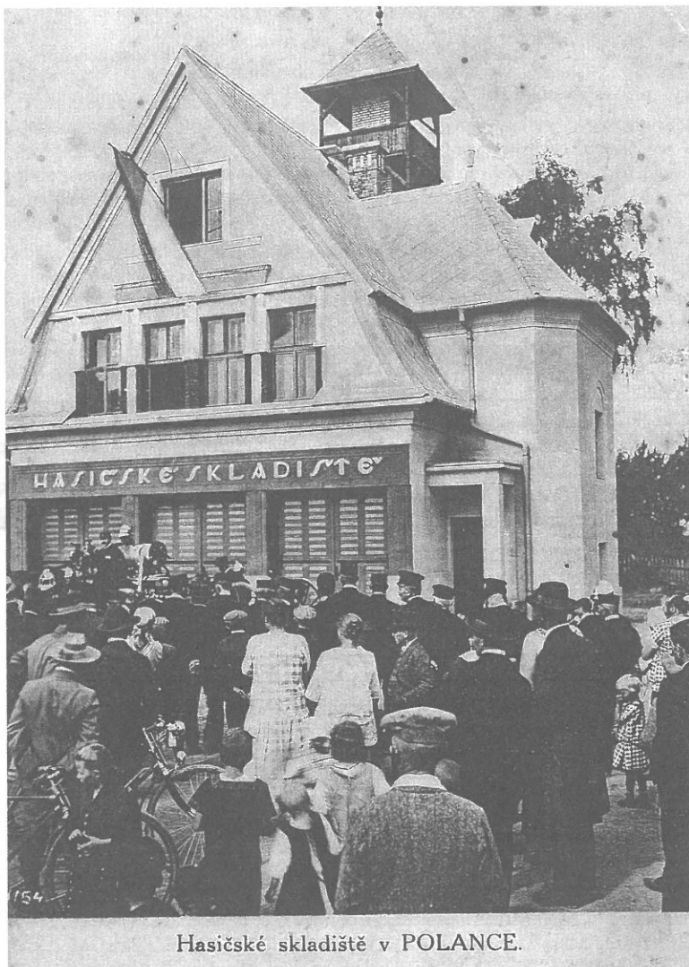
Hasičské skladiště v POLANCE.

Už jen nejstarší generace pamatuje, jakým převratem v denním životě občanů byla elektrifikace Polanky (tehdy se psalo o elektizaci). Při-