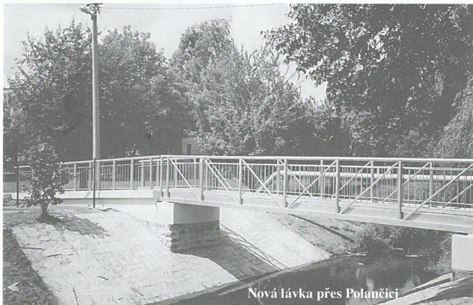
Nová lávka přes Polančici

Velice hezky pro nás OK a. s. Ostrava zcela z „gruntu“ zrekonstruovala lávku přes Polančici (viz. foto) u sokolské louky. Svým moderním a kvalitním provedením by měla nová láv-