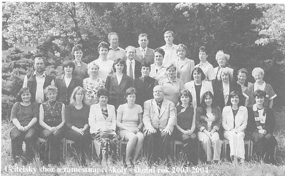
Učitelův sbor a zaměstnanci školy - školní rok 2003/2004

Škola také zorganizovala celou řadu společensko výchovně vzdělávacích akcí. Jmenuji aspoň některé z nich. Cyklisticko vodácký kurz jistě umožnil netradiční poznání příro-