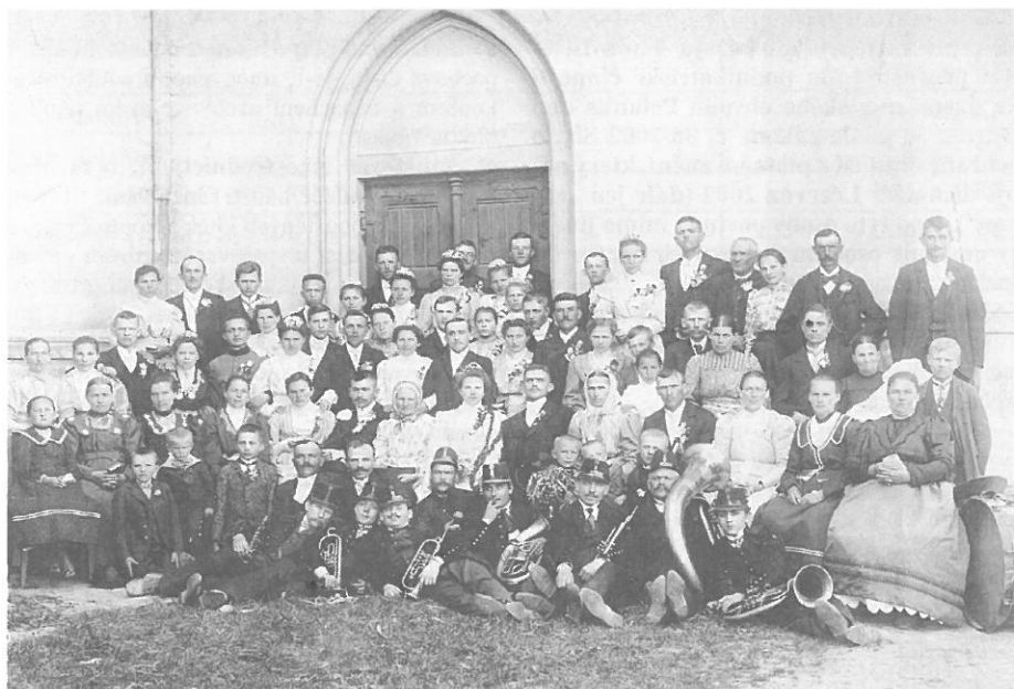
– dobová svatba kolem roku 1920 u kostela Sv. Anny

Na zasedání 10. března 1905 byl pak úřední řečí obce ustanoven jazyk český. Už 19.ledna 1905 zrušila Místní školní rada utraquismus česko-německý na zdejší škole a byl zaveden český vyučovací jazyk. Toto rozhodnutí ovšem zamítla slezská zemská školní rada, načež byl podán rekurz k ministertvu školství, které jej rovněž zamítlo 26. 3. 1906 svým rozhodnutím č. 8777. Poté následovalo ze strany obce podání stížnosti k c. k. správnímu dvoru. Čeština se pak stala vyučovacím jazykem až od školního roku 1907/1908 (o školství v obci podrobněji v publikaci „180