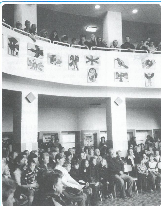
Zaplňený sál školy při slavnostním programu k 50. výročí ZŠ H. Salichové