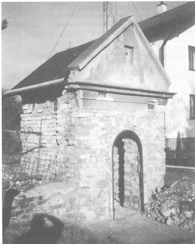
Zahájené práce na opravě kapličky sv. Vendelína