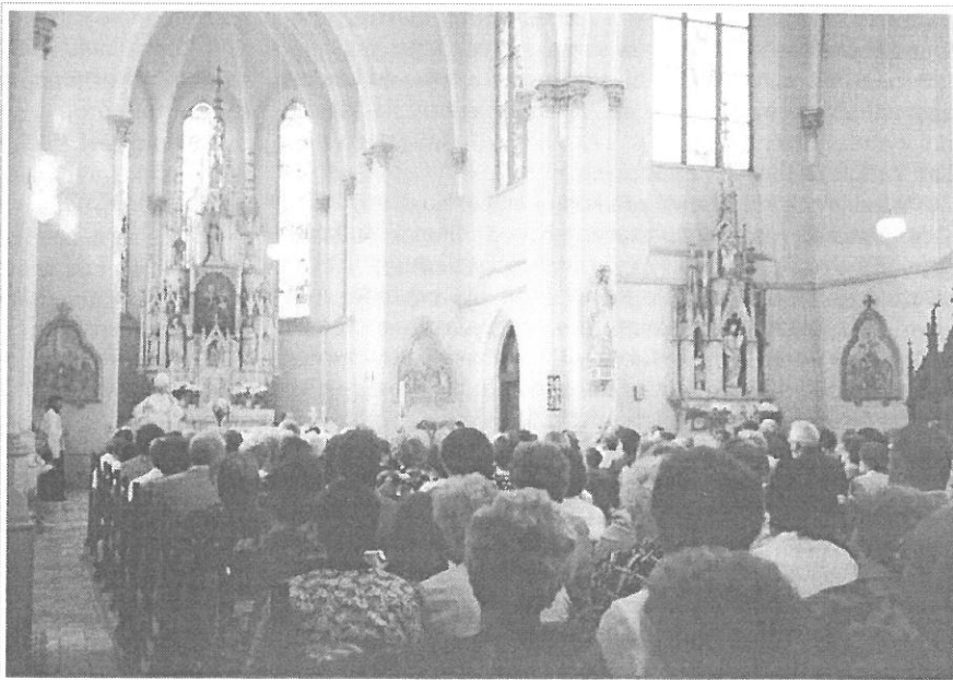
Kostel plný návštěvníků svědčí o významu a důležitosti vzácné události – – 100 let vysvěcení kostela sv. Anny.