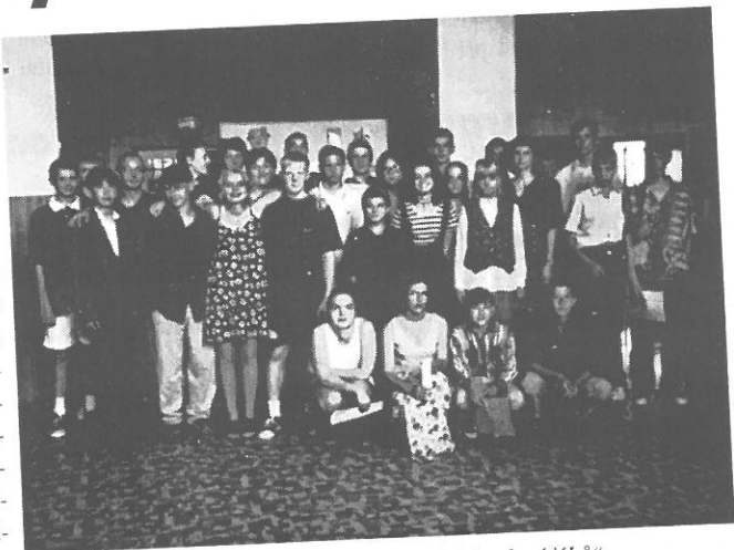
Poslední společné foto loňských „devátáků“

Podejte mi tedy vysvětlení, kdo v naší obci ničí vše, co se s obtížemi snaží pracovníci ůra-