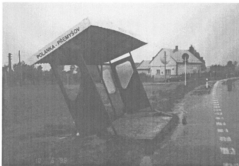
Již několikrát nabouraná zastávka autobusu na Janové – Přemyšově, která je umístěna bobužel na velice problematickém místě.

Dovoz zboží až domu zdarma! Prodej za hotové i na splátky.