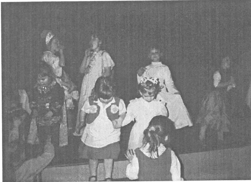
Oblédnutí za plesem dětí z mateřské školky

Mnozí občané mají určitý historický přehled v dění tělocvičných jednot v Polance nad Odrou. Bohužel, mezi mladou generací však dochází k častým omylům při uvádění informací, které se týkají té či oné sportovní organizace jako například konstatování „...chodím do Sokola na dělníáku...“. Omyl, dnes na „dělníáku“ žádný Sokol není.