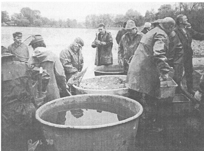
Úspěšný výlov polních rybníků na podzim 1998