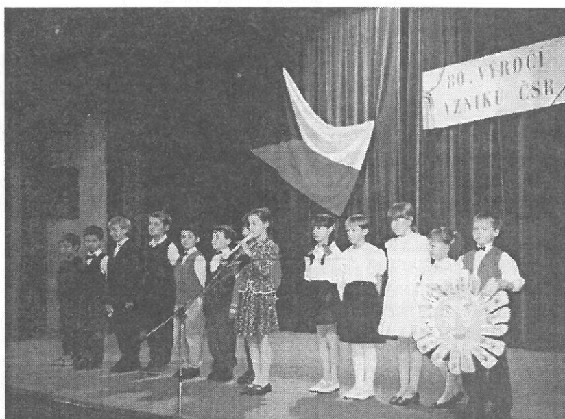
Vystoupení žáků ZŠ k 80. výročí vzniku ČSR