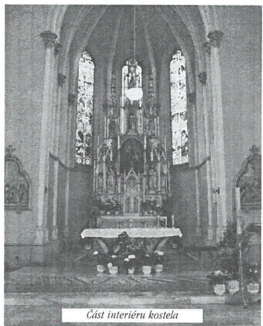
Část interiéru kostela

Největší díl a tíha zodpovědnosti za záchranu této kulturní památky samozřejmě leží na bed-