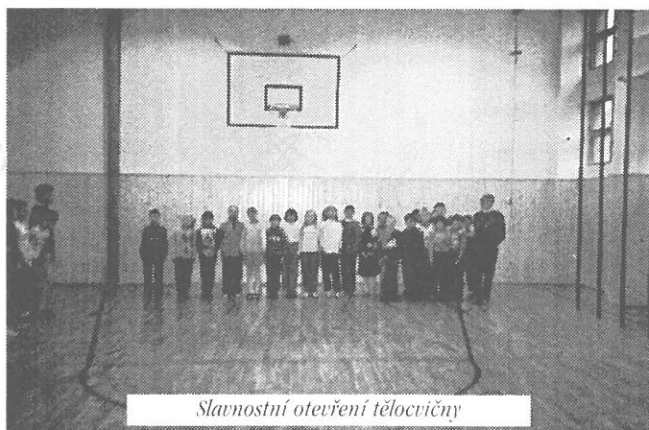
Slavnostní otevření tělocvičny

V září tohoto roku byla ukončena letos naše největší investiční akce – „Rekonstrukce střechy tělocvičny ZŠ“, kterou v průběhu prázdnin realizovala firma ALPINE IPS Ostrava, a. s.