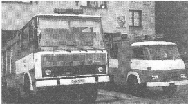
Nová technika je již doma.

V sobotu oslavy pokračovaly „Slavnostní valnou hromadou“ a ukončeny byly společenskou zá-