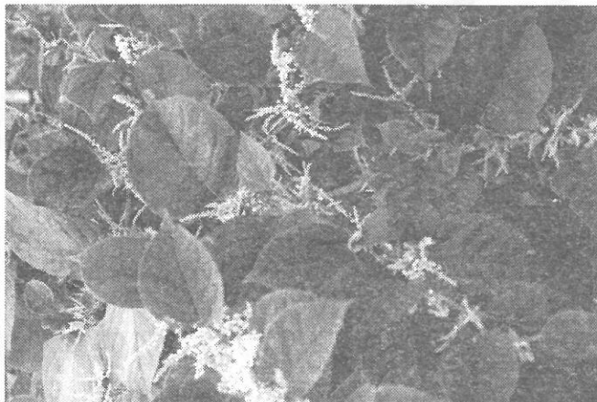
Reynoutria japonica HOUTT. – křídlatka japonská

V krajním případě lze doplnit tato opatření postřikem kmene do výše prvních větví kontaktním insekticidem VASTAC 10 SC, v koncentraci 0,03 %. Z ustanovení zákona 147/1996 Sb., o rostlinolékařské péči a změnách některých souvisejících zákonů rovněž vyplývá povinnost vlastníka či uživatele omezovat výskyt a šíření škodlivých organismů tak, aby v důsledku přemnožení nevznikla škoda jiným osobám a nedošlo k poškození životního prostředí a zdraví lidí nebo zvířat (§ 4), a provádět ošetřování jen registrovanými přípravky při dodržení podmínek stanove-