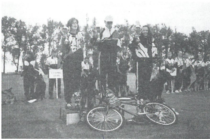
Ti nejlepší se svými svěrci na stupních vítězů