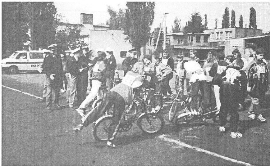
Poslední „válečná“ porada v obou táborech těsně před startem.

Nebylo důležité, kdo zvítězil, důležitější bylo se této tolik prospěšné akce zúčastnit. —PK—