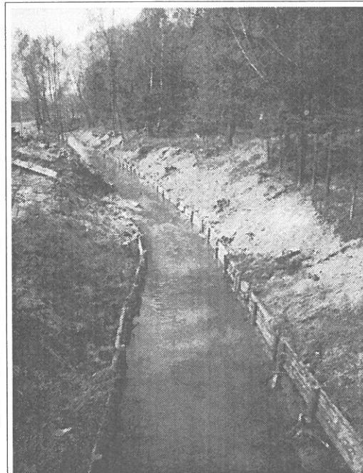
Takto se provádí čištění a úprava Polančice. Snímek je z dolního toku na Hraničkách.