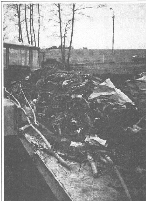
Část ručně separovaných odpadků z toku Mlýnky.

Možná že si někdo řekne, že jsem snílek a idealista, když