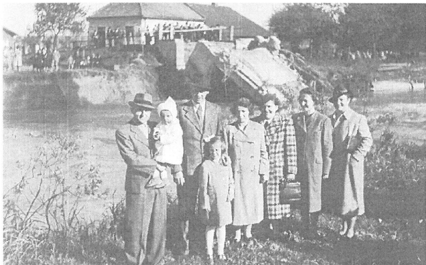
Zřícený most přes Odru u Honzuly – po 28. květnu 1940.

Zápisy z dalších let jsou velmi stručné, o drobných povodních tam není ani zmínky. Až v roce 1937: „Koncem ledna t. r. napadlo mnoho sněhu, který koncem února roztál. Nastalo velmi deštivé počasí, takže Polančice ve čtrnácti dnech šestkrát vystoupila z břehů a rozbila na Malé Straně cestu tak, že tam nebylo možno přejet. Také jarní práce následkem deštů se velmi opozdila... V září začaly lijáky, takže 13. a 14. září Odra i Polančice způsobily takové záplavy, jakých nebylo již mnoho let.“