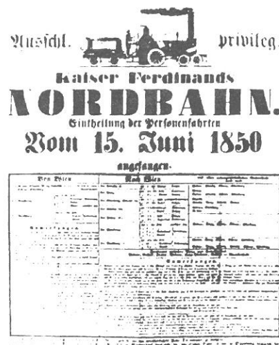
Jízdní řád Severní dráhy Ferdinandovy z r. 1850