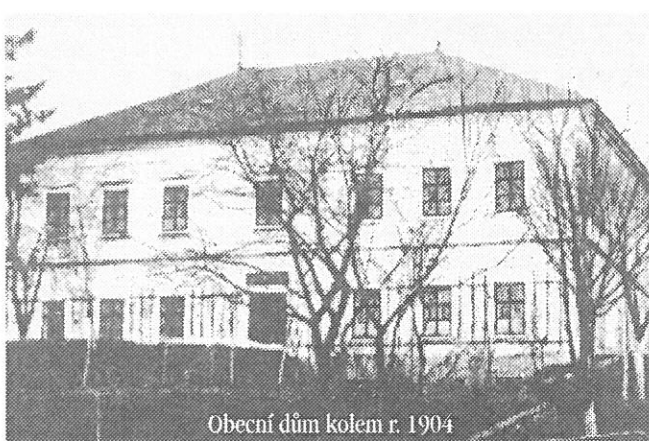
Obecní dům kolem r. 1904