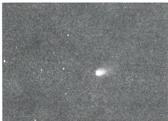
Komet Hale-Bopp fotografovaná 25. 2. 1997 v Polance.