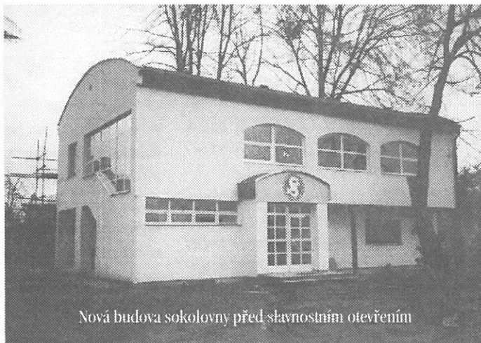
Nová budova sokolovny před slavnostním otevřením

V okolí hraje celá řada družstev soutěže na vysoké úrovni a byli bychom rádi, kdyby se ča-