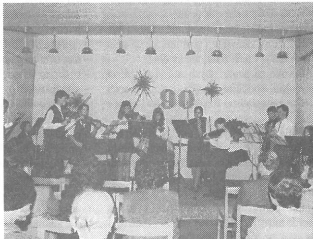
▲ Slavnostní koncert žáků ZUŠ k oslavám 180 let školství v Polance a 90 let budovy „staré školy“