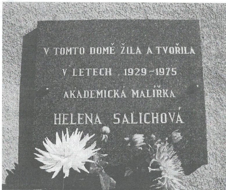
▲ Pamětní deska H. Salichové - po montáži 29. září 1995 (odhalení 30. září 1995)