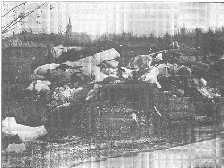
▲ Otrěsná vizitka naší obce - černá skládka na ulici Janovské u bývalé pískovny