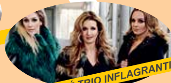
HOUSLOVÉ TRIO INFLAGRANTI

Akci pořádá městský obvod Polanka nad Odrou.