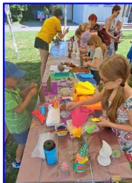
Dřívko – tady fantazie jela na plné obrátky. Z flísu, barevných a chlupatých drátků, papírových kytiček či copánků z vlny děti tvořily různé dřevěné trpaslíky (holičky, piráty, kuchaře atd)

Sádrový trpaslík – na těchto trpaslících se vyřádili úplně všichni (velcí, malí i ti starší) a to někteří i několikrát.