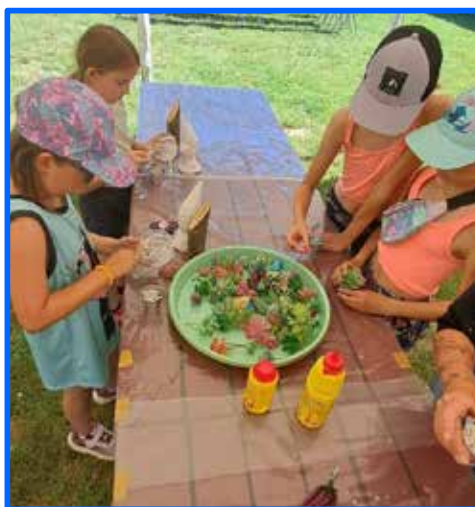
Kyblíček – zde děti sadily kytičku dle svého výběru do bílých kamínků.