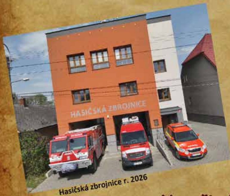
Hasičská zbrojnice r. 2026